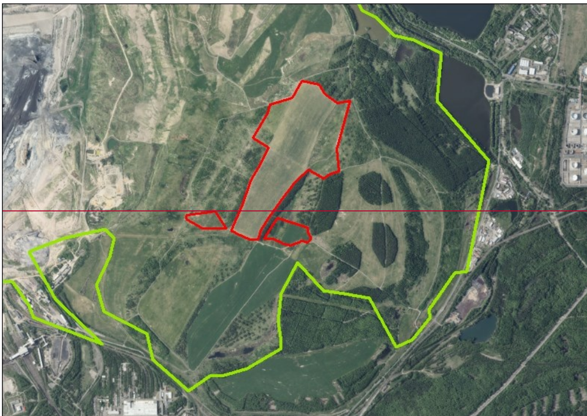
Schéma vymezení plochy Z.29-VE (označené červenou linií) uvnitř území ASA3 (VA.A3) (označené zelenou linií). Plocha Z.29-VE se nachází v malé části území ASA3 (VA.A3), plní a umožňuje splnit veškeré úkoly stanovené AZÚR ÚK pro asanační území nadmístního významu ASA3.

Dopravní dostupnost je umožněna v převažující části území, stavby dopravní infrastruktury jsou přípustné v plochách WU, v NU (účelové komunikace, stezky pro pěší a cyklisty), související dopravní infrastruktura je přípustná v plochách VE. Možnost rozvoje příměstské a regionální rekreace se předpokládá zejména v plochách K.1 WU a K.2 NU, podrobnější řešení bude prověřeno územní studií US.1, mezi její úkoly patří stanovit základní koncepci obnovy celého vymezeného řešeného území po ukončení povrchové těžby, s důrazem na obnovu původního charakteru kulturní krajiny a její propojení se stávajícími sídly. Součástí územní studie bude i prověření založení nových prvků ÚSES. Cílem obnovy bude i posílení ekologické stability území a ochrana a zachování biodiverzity. Významnou součástí obnovy bude založení nové vodní plochy v historické poloze Dřínovského jezera.