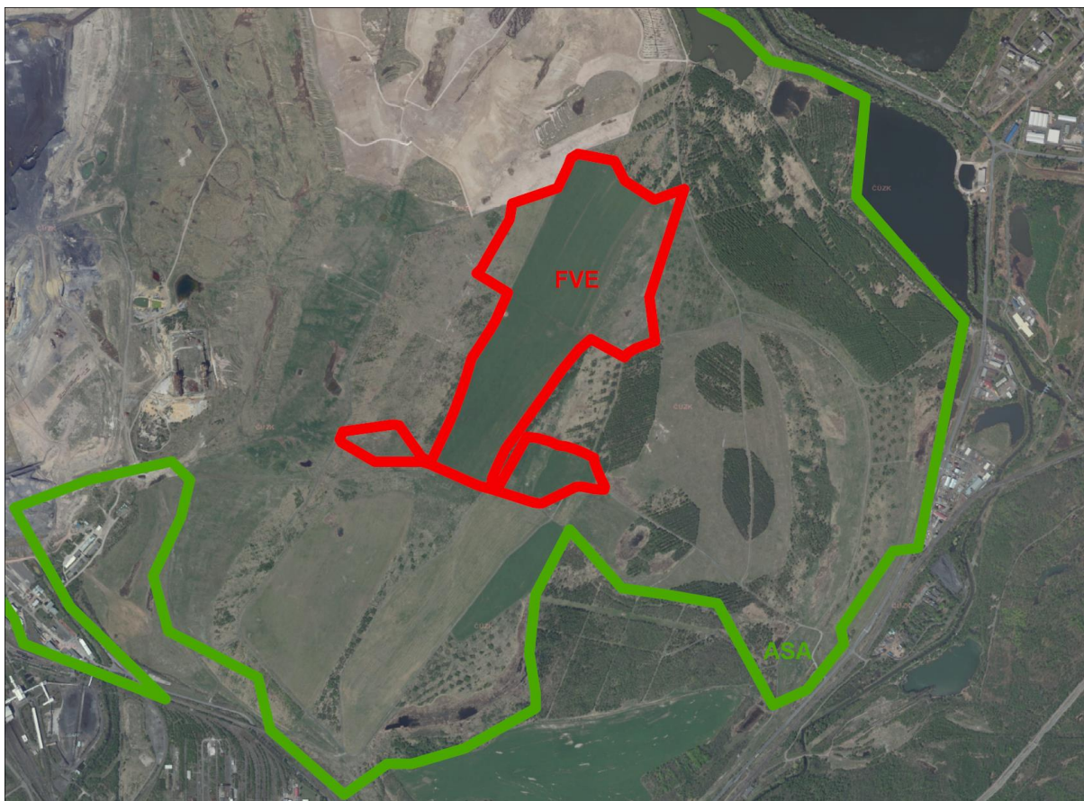
Schéma vymezení plochy Z.29-VE (označené červenou linií) uvnitř území ASA3 (VA.A3) (označené zelenou linií). Plocha Z.29-VE se nachází v malé části území ASA3 (VA.A3), plní a umožňuje splnit veškeré úkoly stanovené AZÚR ÚK pro asanační území nadmístního významu ASA3.

Dopravní dostupnost je umožněna v převažující části území, stavby dopravní infrastruktury jsou přípustné v plochách WU, v NU (účelové komunikace, stezky pro pěší a cyklisty), související dopravní infrastruktura je přípustná v plochách VE. Možnost rozvoje příměstské a regionální rekreace se předpokládá zejména v plochách K.1-WU a K.2-NU, podrobnější řešení bude prověřeno územní studií US.1, mezi její úkoly patří stanovit základní koncepci obnovy celého vymezeného řešeného území po ukončení povrchové těžby, s důrazem na obnovu původního charakteru kulturní krajiny a její propojení se stávajícími sídly. Součástí územní studie bude i prověření založení nových prvků ÚSES. Cílem obnovy bude i posílení ekologické stability území a ochrana a zachování biodiverzity. Významnou součástí obnovy bude založení nové vodní plochy v historické poloze Dřínovského jezera.